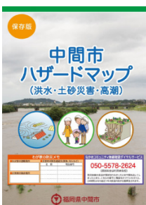
▲中間市ハザードマップ

議員 価格保障や所得補償を強化し、農業を基幹産業として再生することが国に対して求められています。中間市においても農業政策を充実していただくよう要望します。