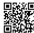
中間市議会 QR コード