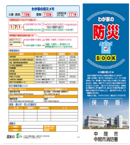
▲わが家の防災チェックBOOK

希望を持てるような学校づくりに向け、多くの方と検討を重ね試行錯誤し、目指すべき学校作りに取り組んでいただくようお願いいたします。