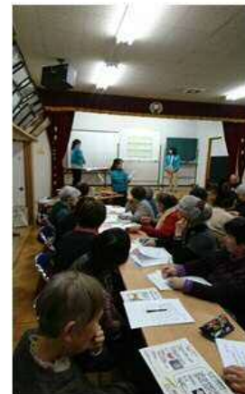
介護保険課による、 くらしに役立つ話

終了後のアンケート調査では「大変面白い企 画でした」「2か月に1回開催してほしい」 等といったご意見が多数でした。 今後は、開催地域を南校区全体に広げていく 予定です。