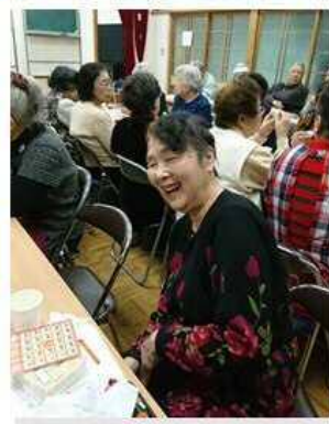
ビンゴゲーム大会

終了後のアンケート調査では「大変面白い企 画でした」「2か月に1回開催してほしい」 等といったご意見が多数でした。 今後は、開催地域を南校区全体に広げていく 予定です。