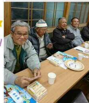
コーヒーと サンドウィッチで ブレイク