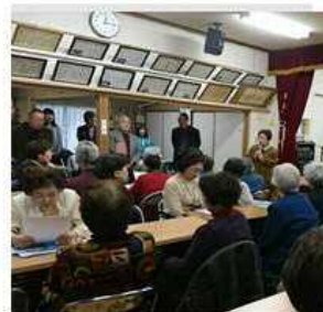
朝霧自治会長、 まち協会長挨拶

2月10日(土)朝霧公民館にて、南まち協・朝霧自治会・明朗クラブ・ 中間市安全安心まちづくり課・介護保険課と共催で、地域の独居老人 の孤立を防ぐことを目的とした「おひとりさまのつどい」を開催しま した。