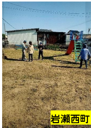
岩瀬西町2区自治会