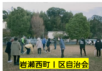
岩瀬西町1区自治会