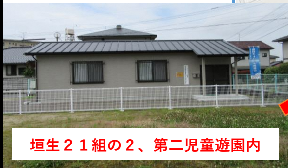
垣生21組の2、第二児童遊園内