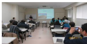
在宅医療出前講座