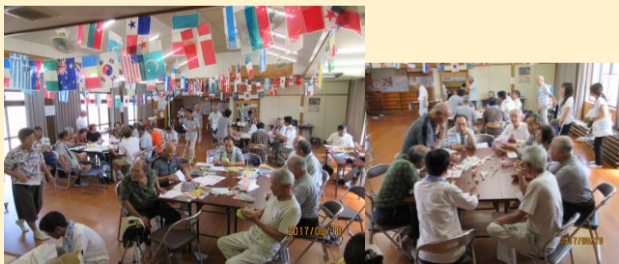
8月19日、自治会協力者に講習会を行いました！

8月25日(金)底井野小学校2学期始業式終了後に底井野校区まちづくり協議会主催の『校区児童と地域のふれあいまつり』を開催しました。児童77名、保護者、自治会等総勢157名が参加し、かざぐるまや竹笛、ゴム鉄砲等を作りました。また、けん玉や将棋等の昔なつかしい遊びを地域の方々に教えて頂き一緒に遊ぶ様子はとても微笑ましかったです。校区の皆様、ご協力ありがとうございました。