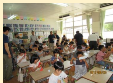
1. 2年生 かざぐるま、バランス紙トンボ作り