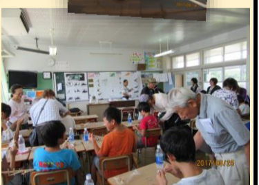
5. 6年生 ゴム鉄砲、やじろべえ