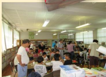
3. 4年生 竹笛組立、バランス紙トンボ作り