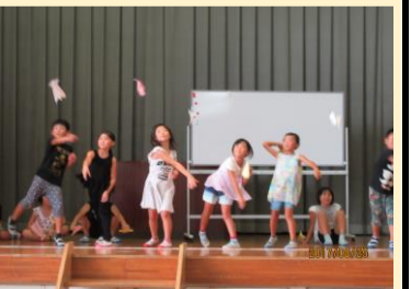
紙飛行機 飛んでいけ～！