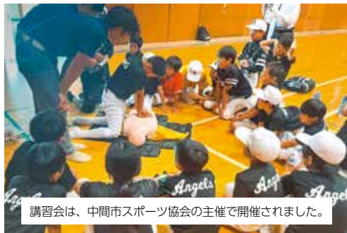
講習会は、中間市スポーツ協会の主催で開催されました。

救命講習会が体育文化センターで開催され、市内のスポーツ少年団やシルバール材センターなどから約40人が参加しました。