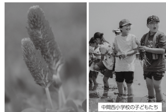
中間西小学校の子どもたち