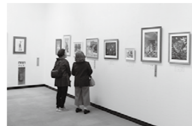
▲たくさんの作品を展示しています。

中間市が主催する美術展 を開催します。幅広い世代 の人たちが手掛けた美術作 品を審査員が審査し、展示 しますので、ぜひ会場で鑑 賞してください。 また、各部門の 中から優れた作品 を表彰します。 ●日時 11月1日(日)～3 日(火)・9時～17時 ※3日(火)のみ15時まで ●場所 なかまハーモニーホール ●作品募集 出品票と出品規定要項 は、中央公民館、なかまハ ーモニーホールに用意して います。 ●募集部門 絵画、書道、 写真、陶芸、自由 ※公募展で未発表のものに 限ります。 ※全部門を通して、出品は 1人2点までです。 ●出品規定 ○絵画：日本画、洋画(水彩・ 油彩・パステル)、版画、 染色とし、4号～100号で 額装または軸物 ○書道：たて作品で半切～ 二八(全紙可)、額装また は軸物 ※書き下ろし、よこ作品は 不可です。 ○写真：単写真、組写真と も四つ切以上で枠張り ○陶芸：縦・横・奥行とも に50cm以内、重量は10kg 以内 ○自由：ちぎり絵、押し花、 グラフィックデザイン、カ リグラフィとし、4号～ 100号で額装または枠張り ●応募資格 ○原則として市内在住・在 勤・在学の人 ○市内で美術製作をしてい る高校生以上の人 ●搬入日時 10月20日(日) 21日(月)・9時～19時 ●搬入場所 なかまハーモ ニーホール展示室 ※搬入期間を過ぎたときは 受け付けできません。 ※作品には必ず吊環とヒモ を付け、出品票を添えてく ださい。 ●搬出日時 ○11月3日(火)・15時～17時 ○11月4日(水)・9時～13時