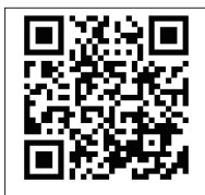
本会議 録画配信 QRコード