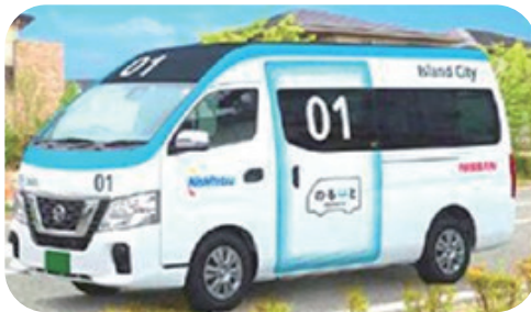
※画像はイメージ図です。

タクシーのような便利さと路線バスの安さを兼ね備えたAI オンデマンドバスを運行します。