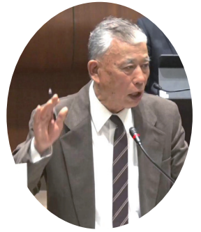
植本種實議員 明政クラブ