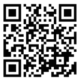
本会議 録画配信 QRコード