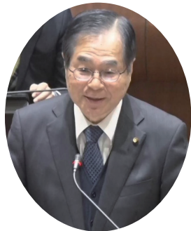
阿部伊知雄議員 公明党