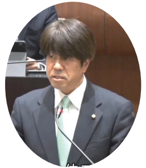
原口佳三議員 公明党