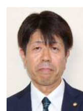
はら きちあさ 原口 佳三 公明党 (公明党)