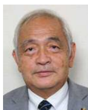
たぐち すみお 田口 澄雄 日本共産党 (日本共産党)