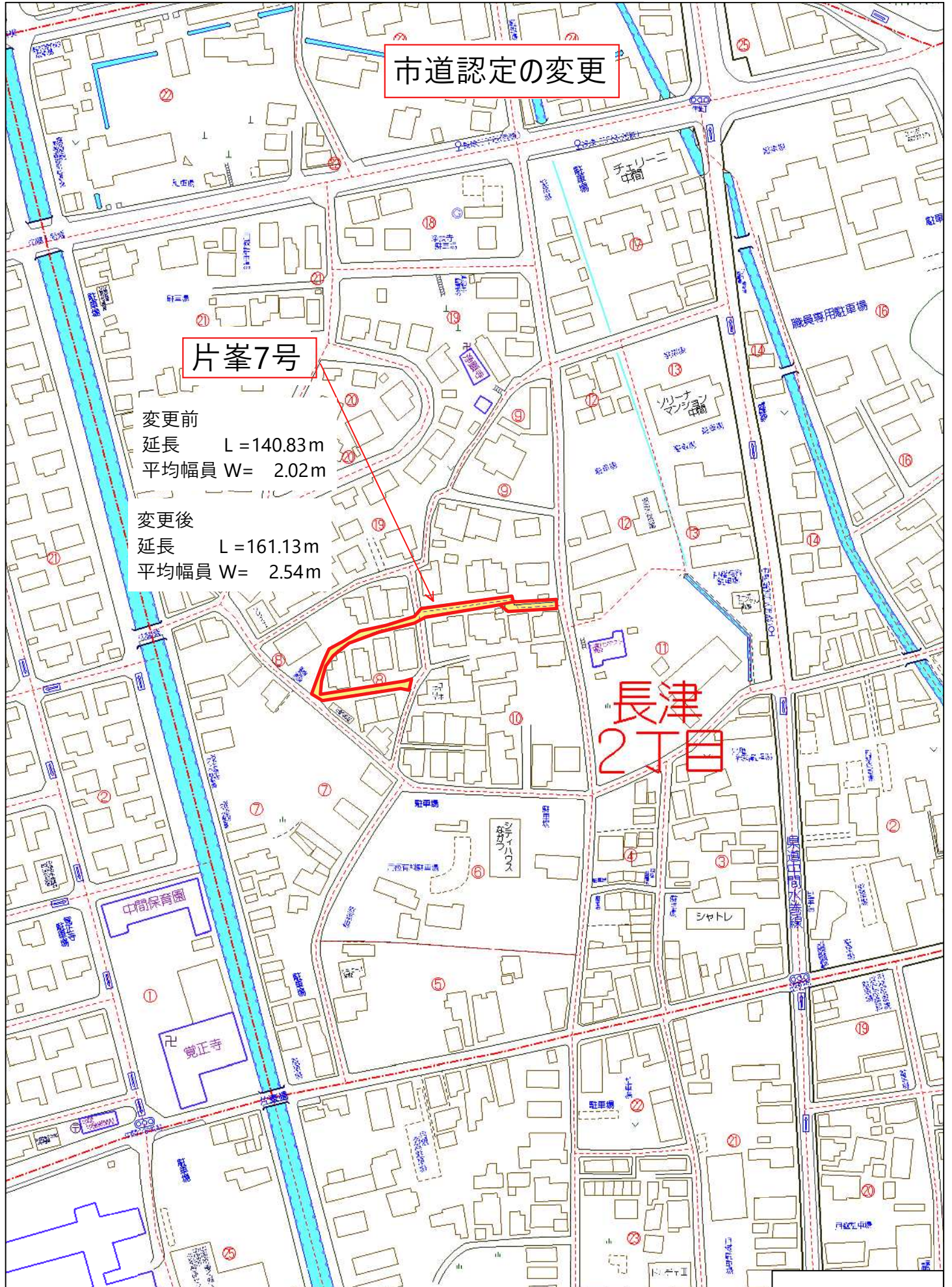
中間市長津2丁目付近