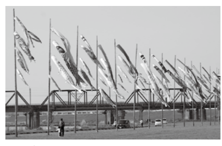
鯉のぼりまつりは、中間市の名物となりたくさんの方が毎年訪れます。

鯉のぼり約150匹が、市役所前遠賀川河川敷で優雅に泳ぎます。新型コロナウイルス感染症対策を行いながら、家族でぜひ遊びに来てください。 ●掲揚期間 5月14日(日)まで(予定)