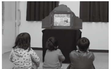
おはなし会で、読み聞かせを真剣に聞く子どもたち。

「子ども読書の日」 「すみっこぐらし」とびだす絵本とひみつのコ」を上映します。 ●日時 4月24日(日)・14時30分から