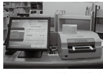
図書館に設置している読書記録通帳機。本の貸出日と題名、作者、価格が印字される。

読書記録通帳で！ 20冊読もうキャンペーン 期間中に20冊の本を記録して、読書記録通帳をカウンターに提示すると、幼児から中学生を対象に記念品をプレゼントするキャンペーンを行います。 ●期間 5月1日(日)～31日(日) ●定員 50人・先着順