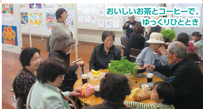
おいしいお茶とコーヒーで、 ゆっくりひととき