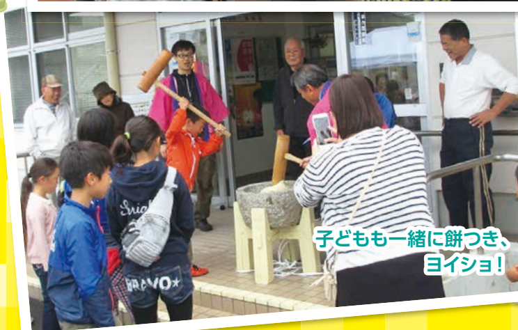
子どもと一緒に餅つき、 ヨイショ!