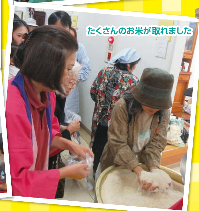
たくさんのお米が取れました