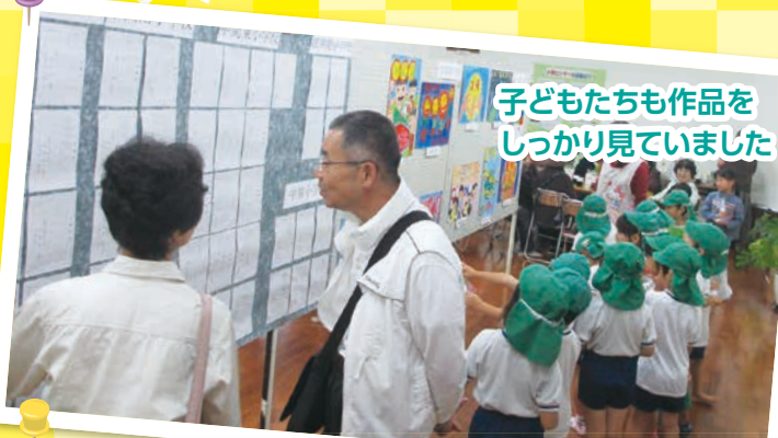
子どもたちも作品を しっかり見ていました

10月22日・23日の両日、中間市人権センターにおいて「第5回よかかせ祭」を開催しました。あいにくの天候でしたが、子どもたちの「人権ポスター」などの作品展示をはじめ、お米すくいや餅つき大会などの企画に、たくさんの方が参加されました。