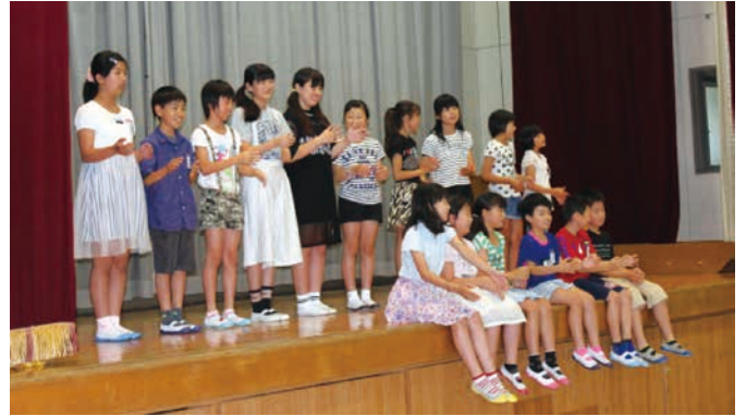
手話クラブによる手話の紹介

南小学校では、ひとり一人を大切にす南小をめざし、児童会の取り組みとして、全校児童による人権集会を行っています。校長先生から、友だちを大切にするこことのお話や手話クラブによる手話の紹介や手話を使った歌を披露しました。