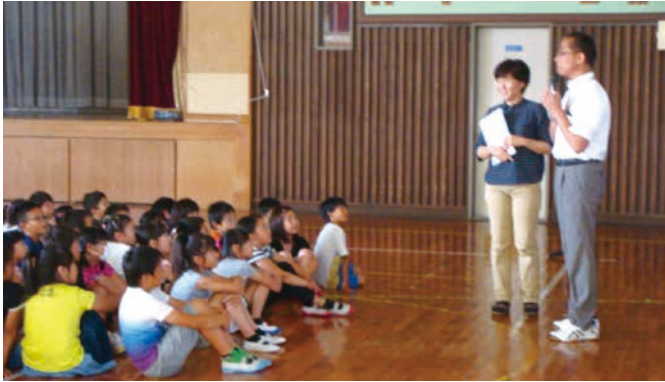
人権の大切さの話を聞く子どもたち