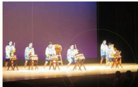
▲今年もすばらしかったです