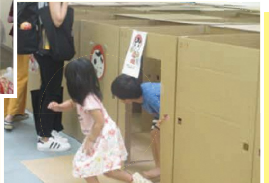
▲ながい迷路迷わず出られたよ