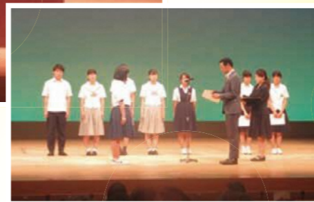
▲発表をしてくれた8名の表彰式