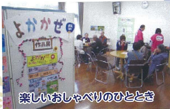
楽しいおしゃべりのひととき