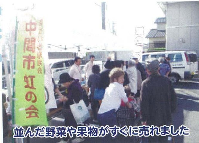
並んだ野菜や果物がすぐに売れました