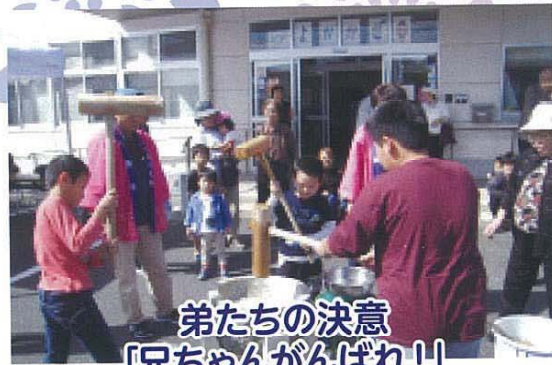
弟たちの決意 「兄ちゃんがんばれ!」