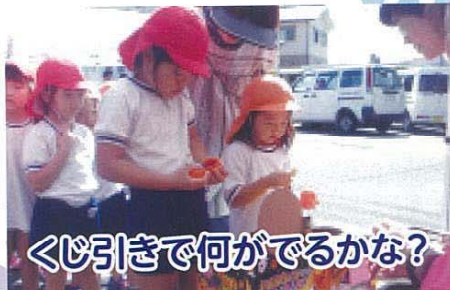
くじ引きで何がでるかな?