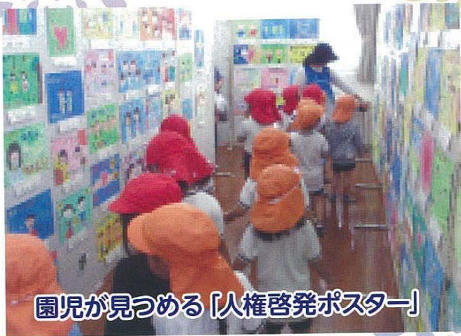
園児が見つめる「人権啓発ポスター」