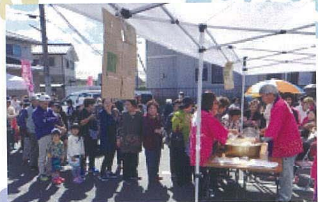
今年の「お米すくい」はからっぽに!