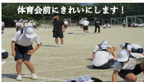
体育会前にきれいにします!