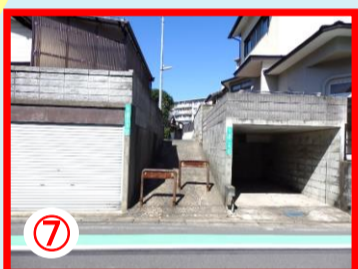
⑦ 深坂から県営朝霧団地に抜ける通り 夜間注意のいる場所