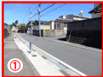
① 西部ガス前の通り 自転車の飛び出し注意

近年、西校区ではサルが出没しています。サルに遭遇した場合は、大声を出したりさわいだりしない、石を投げたり追いかけてたりしない、目を合わせない様にしましょう。