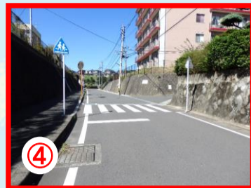
④ 県営池田団地南側横断歩道 自転車の飛び出し注意