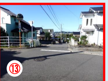
⑬ 七重町3番付近 西小児童につきまとい事案があつた場所