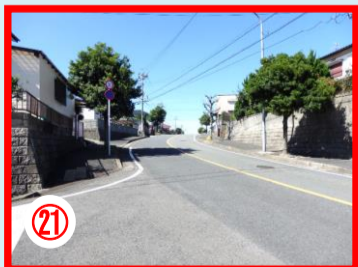
②1 小田ヶ浦のバス通り 交通量の多い場所・見通しの悪い場所