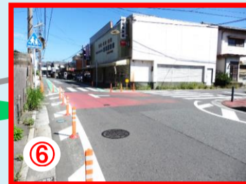
⑥ 深坂公民館前の交差点 道路幅が急に狭くなる場所 通学児童の多い場所