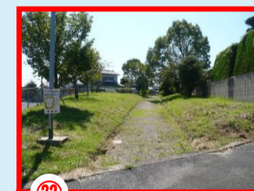
②2 小田ヶ浦のしま馬公園 過去に不審者情報のあつた場所 自転車での転倒事故があつた場所