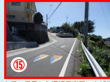
⑱ 七重の信号から深坂保育園に上がる場所 見通しの悪い場所、通学児童の多い場所