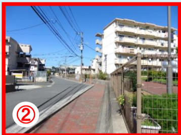
② 県営池田団地周辺 声かけ事案多発の場所 H27年3件・H28年1件