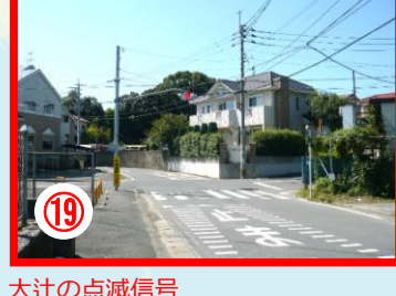
⑱ 大辻の点滅信号 通学児童の多い場所 交通量の多い場所