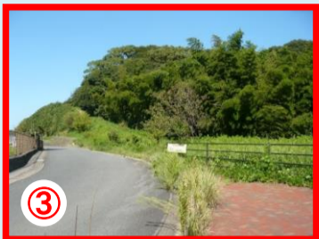
③ 県営池田団地南側 夜間注意のいる場所