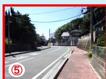
⑤ 深坂から大辻への点滅信号の交差点 西小へ向かう曲がり場所 通学児童の多い場所 見通しの悪い場所