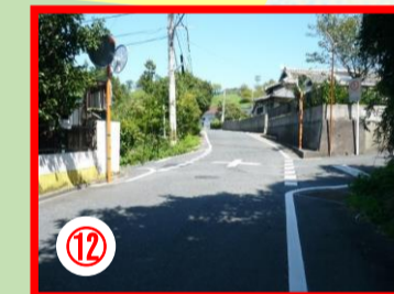
⑫ 大辻から油坂への交差点 見通しの悪い場所