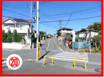
⑱ 大辻の点滅信号から西小へ行く坂道 西小児童に声かけ事案があつた場所