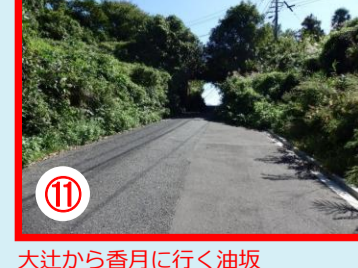
⑱ 大辻から香月に行く油坂 見通しの悪い場所 夜間注意のいる場所