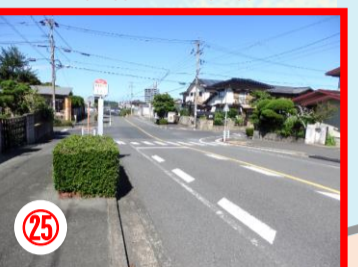
②5 小田ヶ浦のバス通り 交通量の多い場所