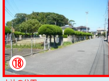
⑱ 大辻の公園 過去に不審者情報のあつた場所