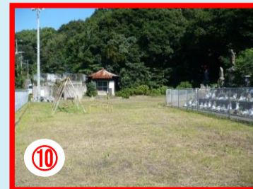
⑱ 深坂地藏公園 夜間注意のいる場所