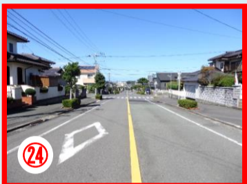
②4 小田ヶ浦のバス通り 交通量の多い場所