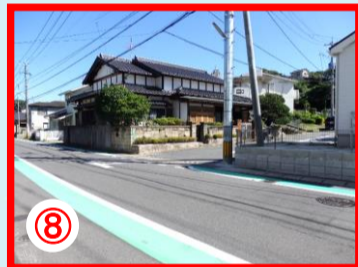
⑧ 深坂市営住宅入口 自転車の飛び出し注意 車と自転車による交通事故発生場所