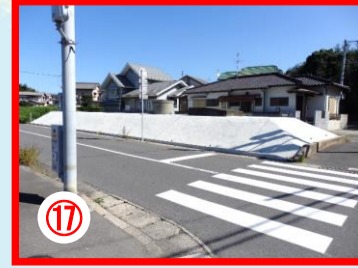
⑱ 大辻ローソン横 送水管上での自転車乗り危険注意