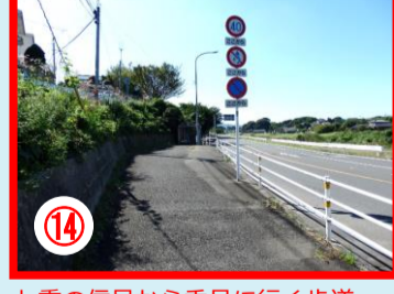
⑱ 七重の信号から香月に行く歩道 街灯が少なく夜間注意のいる場所