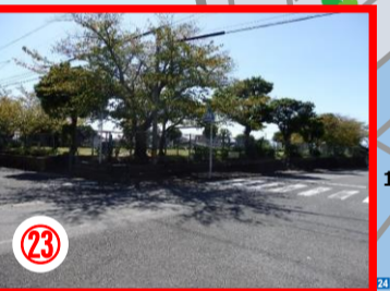
②3 小田ヶ浦居酒屋前の公園 女児に声かけ事案のあつた場所