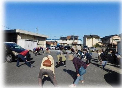
ケガのないよう準備運動