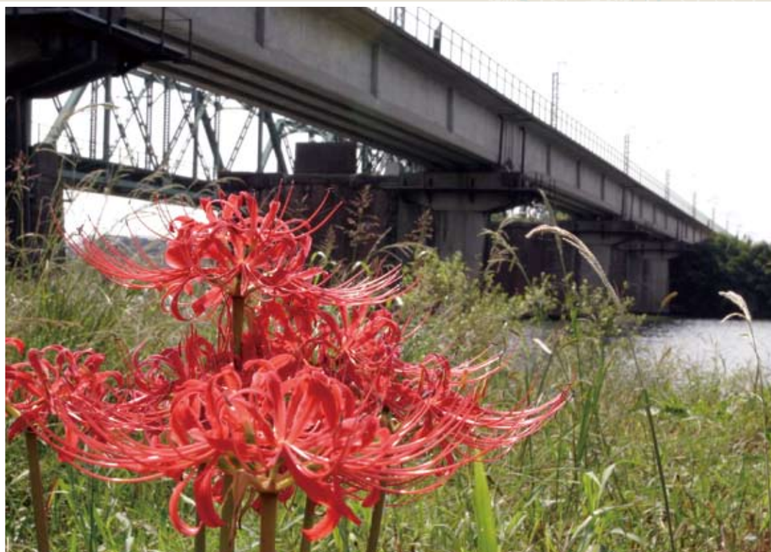
→遠賀川河川敷に人知れずぼつりと咲く彼岸花。