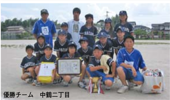
優勝チーム 中鶴二丁目

8月5日、中間南小学校で「第5回中間市青少年育成市民会議キックベースボール大会」が開催されました。猛暑の中、保護者や多くのみなさんの大きな声援を受け、子どもたちはその声に後押しされたかのように力いっぱいのプレーを展開していました。