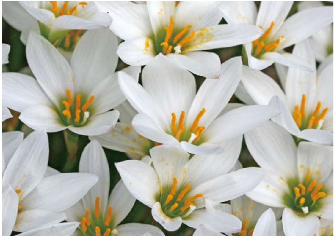
→下蓮花寺の公園に咲く玉簪。並んで二斉に咲く姿は壮観。