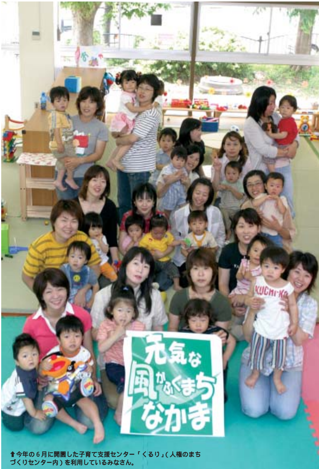
↑今年の6月に開園した子育て支援センター「くるり」(人権のまちづくりセンター内)を利用しているみなさん。

総合計画とは、これからの中間市がどのようなまちを目指していくかという目標や、その目標に向かってどのように事業などを展開していくかというまちづくりの基となる設計書のようなものです。 今後10年間、この計画に沿ってより良いまちづくりを進めていきます。