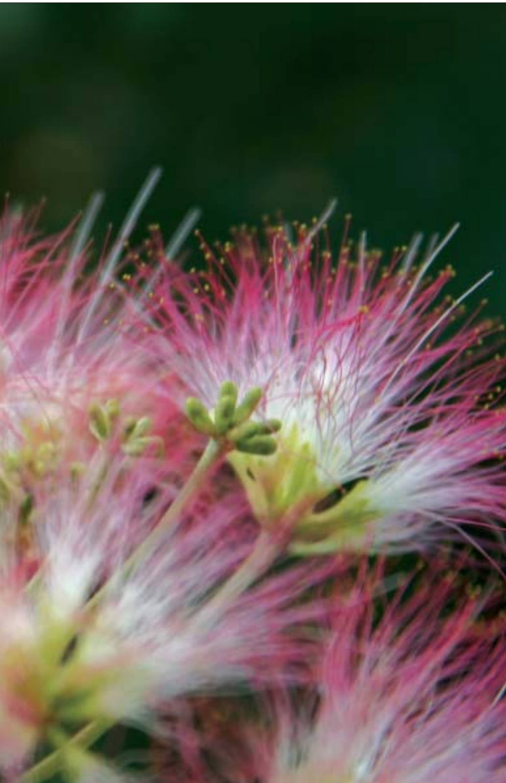
↑中央三丁目曲川沿いに咲くネムノキの花

このページでは、市民のみなさんからの俳句、川柳、短歌や季節を感じさせる写真の投稿お待ちしています。 投稿は1作品ごとで、住所、氏名(ペンネーム希望は別途明記)、電話番号、写真の場合はコメントを記入のうえ、『T809 8501 中間市秘書課広報広聴係』へお送りください。