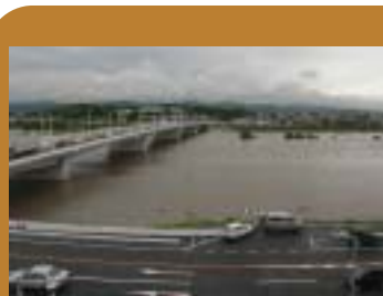
6月23日、大雨で増水した遠賀川。これからの時期、台風などの大雨で市役所前河川敷駐車場は冠水することがあります。駐車の際はご注意ください。