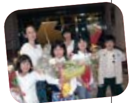
5月ご出演のみなさん