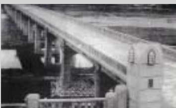
昭和に架け替えられた橋はコンクリート製 昭和5年9月21日、架設工事が着手され、昭和6年12月15日竣工。総工事費12万500円であった。同橋梁は、延長327メートル、橋脚9.5メートルの鉄筋コンクリート製。