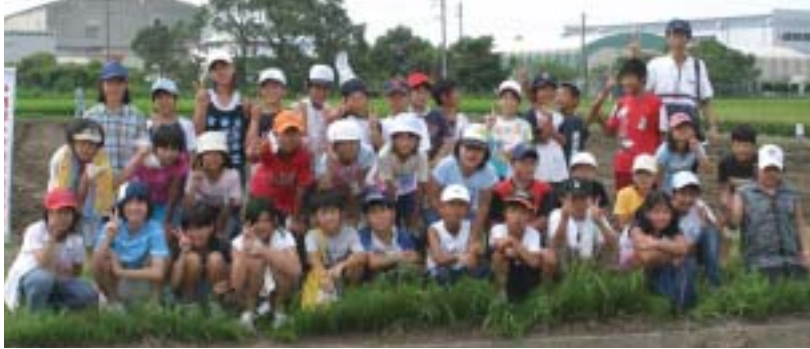
南小学校5年生のみなさん