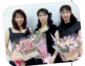
12月ご出演の みなさん