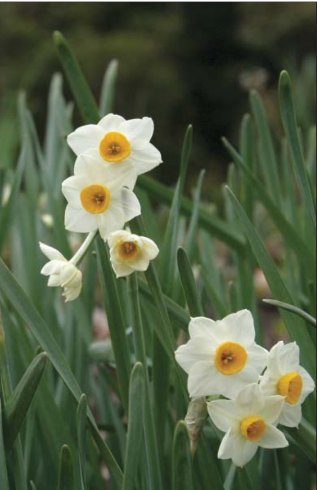
↑朝霧で見つけた水仙

このページでは、俳句、川柳、短歌や季節を感じさせる写真(市内で撮影されたもの)の投稿お待ちしております。 投稿は1作品ごとで、住所、氏名(ペンネーム希望は別途明記)、電話番号、写真の場合はコメントを記入のうえ、『T8009 8501 中間市秘書課広報 広聴係』へお送りください。