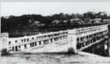
遠賀川大改修工事で初代遠賀橋が架けられる 初代遠賀橋は、明治から行われていた遠賀川の大規模な改修工事に伴い、大正8年3月に架けられた。この橋は、人力車や馬車が通るとびがタガタと音が鳴る木橋であった。

今後、この橋は、両岸を結ぶネットワークとして、これまで以上に東西地区の結びつきを強め、都市機能の活性化や計画的な都市の整備、円滑な交通の確保、歩行者の安全性の向上などに重要な役目を果たすこととなります。