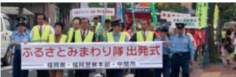
↑出発式終了後、小雨の降るなかJR中間駅までパレードを実施。

なりました。 プロジェクトの内容は、市民ボランティアのみなさんを中心に、非行を防止するための街頭パトロール活動や青少年の犯罪抑止および環境浄化を推進する活動を行い、行政や県警と連携して、安心、安全なまちづくりを目指していくものです。 『ふるさとみまわり隊』は、まちの発展のため、また青少年が健やかに成長するために、多くの人々の知恵と経験を生かし、非行防止に力を注いでプロジェクトを実施していきます。