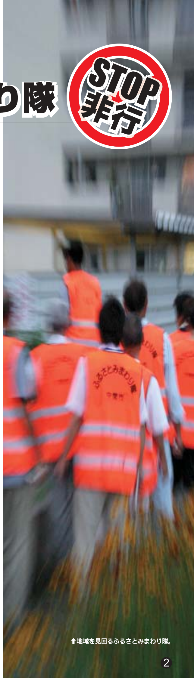
↑地域を見回るふるさとみまわり隊。