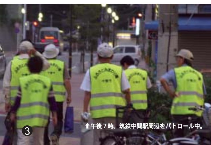
↑午後7時、筑鉄中間駅周辺をパトロール中。