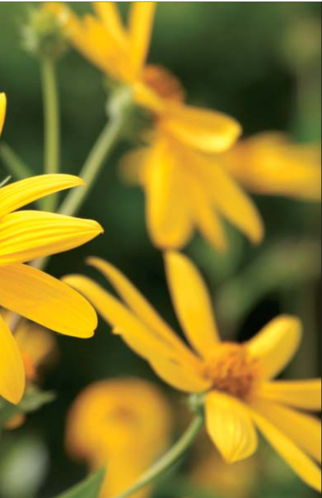
↑山田川の側道に茂る雑草の中でひと際存在感を見せる菊芋

このページでは、市民のみなさんからの俳句、川柳、短歌や季節を感じさせる写真の投稿お待ちしております。 投稿は1作品ごとで、住所、氏名(ペンネーム希望は別途明記)、電話番号、写真の場合はコメントを記入のうえ、『T809 8501 中間市秘書課広報広聴係』へお送りください。