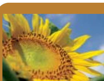
北小学校の花壇で撮影したひまわり。青空とひまわりは夏の定番であり、季節を感じさせる重要な存在。しかしこの日はひと際暑かった。