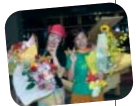
6月ご出演のみなさん