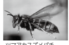
ツマアカスズメバチ