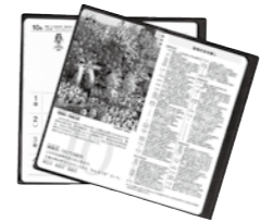
県内の知りたい情報や役立つ情報などが満載です。

申込方法 電話 申込締切 9月30日(日) 申込・問合せ先 財政課 ☎(246)6236