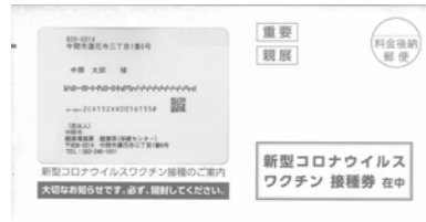
<個別通知見本> 大切に保管をお願いします。

接種時期、会場などは郵送する接種のお知らせを確認してください。 接種券発送時期 ※国が示す接種順位に基づき順次個別に通知します。 ①65歳以上の人：4月中旬以降 ②64歳以下の人：順次6月以降 ※ワクチン供給状況などにより発送予定を変更する可能性があります。 接種方法 「集団接種」を予定しています。 ※かかりつけの医療機関で行う「個別接種」については現在調整中です。 接種までの流れ ①「接種券」、「接種のお知らせ」が届きます。 ※接種可能な時期、接種会場などを案内しています。 ②接種予約の電話をする。 ※相談対応とは別に接種予約専用ダイヤルを接種のお知らせに記載します。 ③接種予約をした人に個別通知が届きます。 ※ワクチン接種に必要な予約票、予約日時などの案内を同封します。