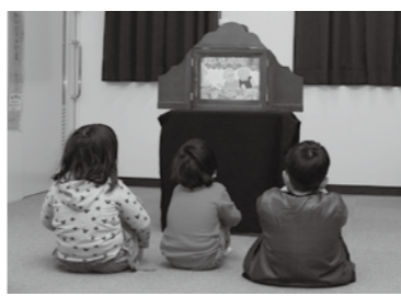
おはなし会で、読み聞かせを真剣に聞く子どもたち。

「子ども読書の日」おはなし会 ほっとブックなかまのみなさんが、紙芝居や絵本『ぞうのエルマー』などの読み聞かせを行います。気軽に参加してください。 ●日 時 4月25日 13時30分～ ●定 員 15人程度 ●場 所 市民図書館