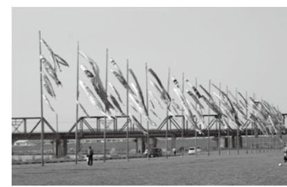
鯉のぼりまつりは、中間市の名物となり沢山の人が毎年訪れます。

鯉のぼり約150匹が、市役所前遠賀川河川敷で優雅に泳ぎます。家族でぜひ遊びに来てください。 ●掲揚期間 5月15日まで ●鯉のぼり提供のお願い 鯉のぼりまつりでは、みなさんからご提供いただいた鯉のぼりを使用しています。掲揚期間中は、常時風雨にさらされるため劣化も早く、鯉のぼりの確保に苦慮しています。 ●問合せ 提供ください。 ○なかま三世代ふれあいの会 佐藤宅 ☎(244)1539