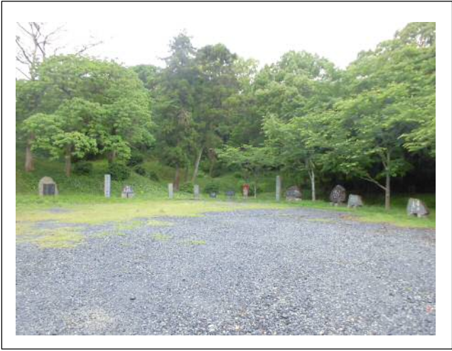
垣生公園内の文学碑