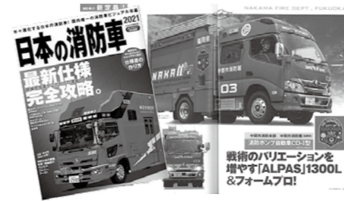
▲6ページにわたって掲載された雑誌「日本の消防車 2021」(イカロス出版)