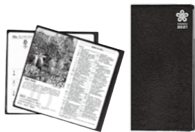
県内の知りたい情報や役立つ情報などが満載です。

●申込方法 電話 ●申込締切 9月25日(金) ●申込・問合せ 財政課 ☎(246)6236