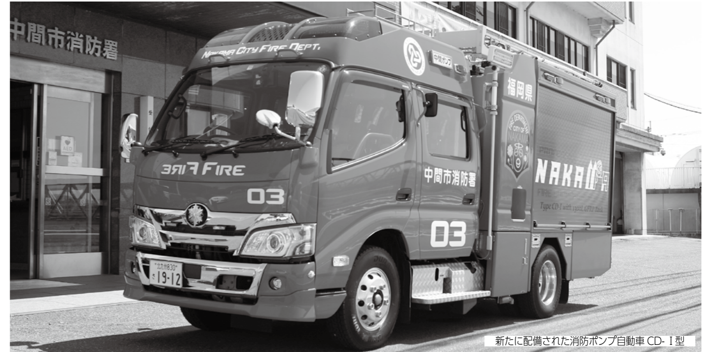
新たに配備された消防ポンプ自動車 CD-1 型

専門家や全国の消防隊員らが注目する消防専門誌に掲載された中間市消防署のポンプ車。厳選された機能を備えるこの最新車両を紹介します。