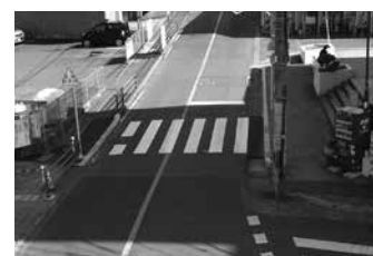
自分の身を守るためにも、交差点ルールを守って通行してください。

中間市自治会連合会から「通谷電停周辺の交通安全対策に関する陳情書(自治会数61、署名数11312人)」が提出され、市は安全なまちづくりのために折尾警察署と協議を行いました。その結果、3月に通谷一丁目1番53号先(石坂皮膚科前)の横断歩道を、鍋山町1番(通谷グリーンハウス前)に移設しました。春は新1年生が入学したばかりで、登下校時には注意が必要です。横断歩道での歩行者優先は、マナーではなくルールです。また、