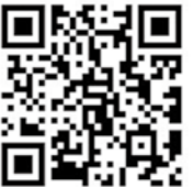
国税庁ホームページ