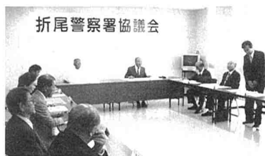
折尾警察署協議会

だれもが安心して暮らせる社会の実現のため、折尾警察署では、「折尾警察署協議会」を設けています。委員は15人で、管内の自治体や、地域の安全に関する活動を行う関係団体、住民の代表者です。