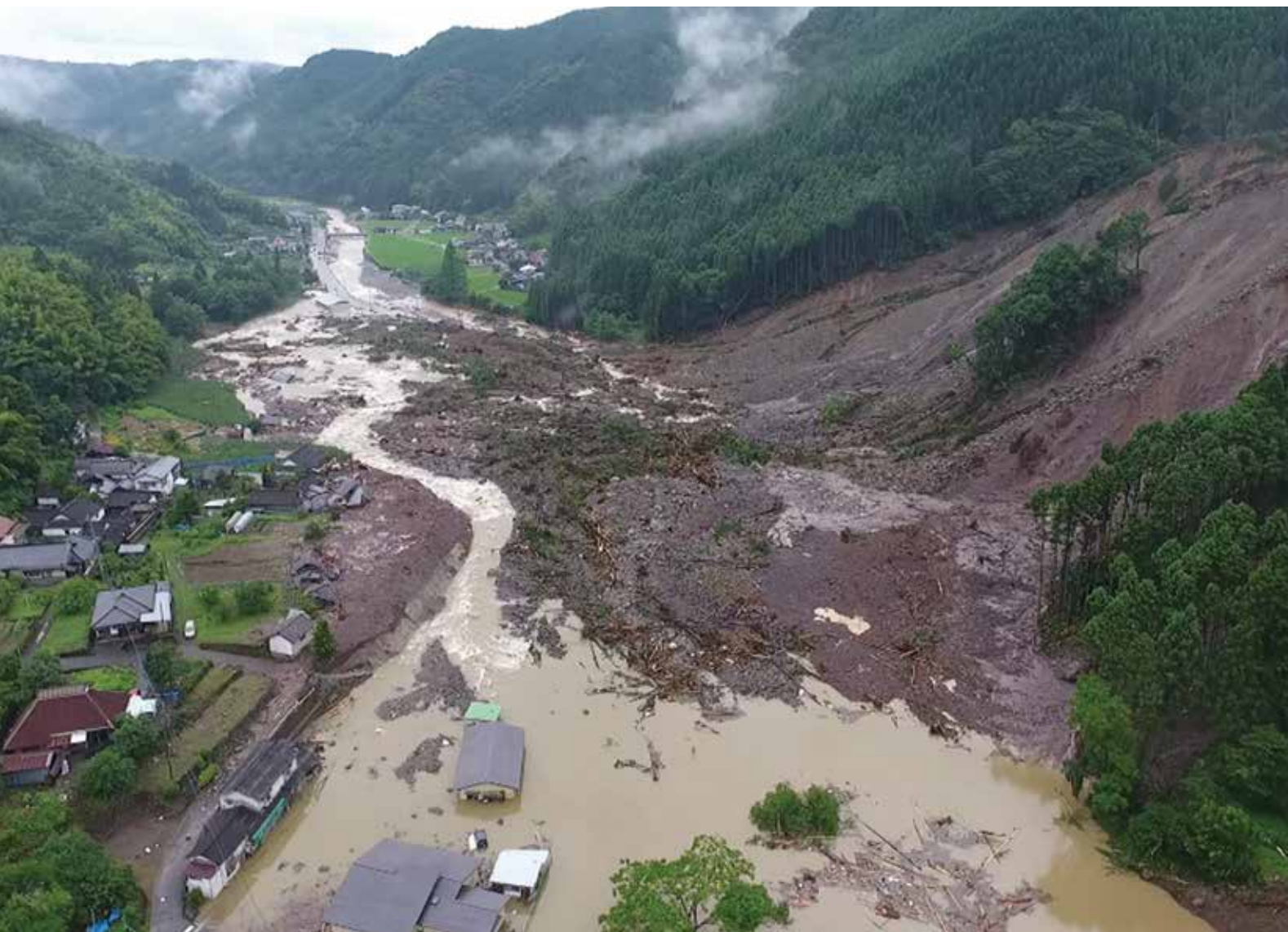
平成 29 年 7 月 7 日、日田市小野地区で撮影された被災状況。

昨年7月、突如として九州北部を豪雨が襲いました。 突然の事態。そして、想定以上の災害に被災地はもちろん、日本中が混乱しました。 いつ自分たちの身に降りかかるかも知れない災害について考えます。