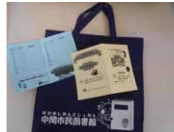
ポイントと交換できる手さげ袋は、限定50個。よむむしくんとなっばがあるよ。

蔵書点検のお知らせ 6月21日(金)～29日(金)は蔵書点検のため、休館します。本の返却は、ブックポストへお願いします。 なお、6月7日(日)～20日(金)は、貸出冊数を無制限に 「雨」の日は本を読んでもみせませんか? 6月は梅雨の季節です。雨が降る日には、雨音を聞きながらゆっくりと本の世界に浸ってみませんか。雨音の中、本とコーヒーというのもいいですね。 「雨」「父の日」「アジサイ」など、この時期ならではの楽しい本を集めました。