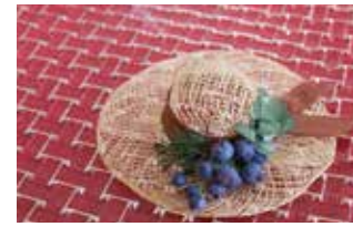
夏らしいさわやかなアレンジを作ってみませんか。

アレンジをするワークショップです。どなたでも気軽に参加してください。 ●期日 6月25日(日)、7月2日(日) ●時間 11時～14時 ●費用 1,000円 ●定員 各回4人 ●申込方法 電話 ●場所・申込先 Simon(夢まるしえ) ☎090(9474)4004