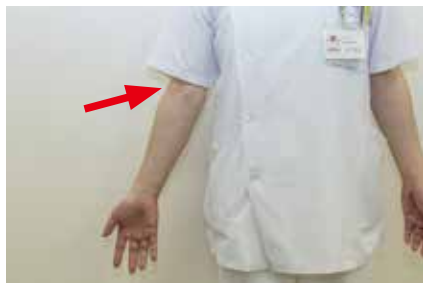
上腕骨外側上顆炎は、ひじの外側(矢印部分)が痛む病気です。