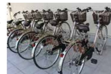
電動アシスト付きなので、楽々で快適です。

A 電動アシスト付きの自転車の貸出しもありますので、遠賀川沿いのサイクリングはいかがでしょう。1日乗り放題で700円なので、おすすめです。地域交流センターは、土曜・日曜日、祝日も開館しています。観光担当職員がいますので、気軽にお立ち寄りください。