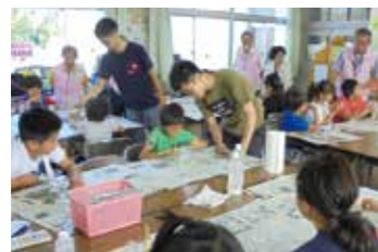
身近な材料でスーパーボールを作る実験で、きれいなボールが完成。

夏休みなかま校区つ子学習室 中間校区まちづくり協議会が、子どもたちに自主学習や体験活動の中でお互いを思いやり、協力する心を持つてほしいと始まった事業も今回で4回目。夏休みの宿題を教えあったり、歴史学習、科学実験、料理作りと盛りだくさんの内容でした。