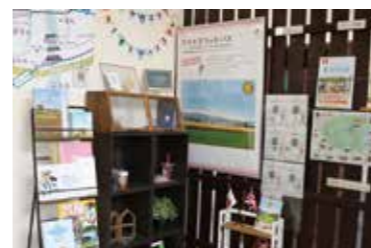
資料が満載で、思わぬ情報が手に入るかも。

A 世界遺産である「遠賀川水源地ポンプ室」を紹介する貴重な映像や資料展示、関連パンフレットを各種取りそろえています。また、フットパスの地図やイベント情報、フットパスで立ち寄れる「フットパスオアシス」のショップカードなどもあります。中