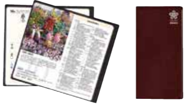
県内の知りたい情報や役立つ情報などが満載です。

福岡県の便利な情報満載の2020年版「福岡県民手帳」の予約を受け付けています。 県民手帳は、県内各地の催しや市町村の概要など、県の知りたいデータがすぐわかる手帳ですので、ぜひ活用してください。 ●価格・色 ○ポケット版：500円・黒、ワインレッド ○標準版(カレンダー式)：600円・黒、ワインレッド、スモークブルー ○標準版(横罫式)：600円・紺色