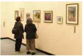
昨年の美術展で絵画に見入る人たち。

幅広い世代の人たちが手掛けた美術作品を展示しますので、ぜひ会場で鑑賞してください。また、各部門の中から、優れた作品を表彰します。 ● 日 時 11月1日(土)～3日(日)・9時～17時 ※3日は15時までです。 ● 場 所 なかまハーモニーホール 作品募集 出品規定要項と出品票は、9月11日(土)から中央公民館で配布します。 ● 募集部門 絵画、書道、写真、陶芸、自由 ※公募展で未発表のものに限ります。 ※全部門を通して、出品は1人2点までです。 ● 出品規定 ○ 絵画 ：日本画、洋画(水彩・油彩・パステル)、版画、染色とし、4号～100号で額装または軸物 ○ 書道 ：たて作品で、半切～二八まで(全紙可)、表装または額装 ※無鑑査はこの限りではありません。 ※書き下ろし、よこ作品は不可です。 ○ 写真 ：単写真、組写真とも4つ切り以上で枠張り ○ 搬入日時 10月21日(土)～22日(日)・9時～19時 ※搬入期間を過ぎたときは、受け付けできません。 ※作品には必ず吊かんとヒモを付け、出品票を添えてください。 ● 搬入場所 なかまハーモニーホール展示室 ● 搬出日時 11月4日(土)・9時～13時 ○ 陶芸 ：縦・横・奥行ともに50cm以内、重量は10kg以内 ○ 自由 ：ちぎり絵、押し花、グラフィックデザイン、カリグラフィーとし、4号～100号で額装または枠張り ● 応募資格 ○原則として市内在住・在勤・在学の人 ○市内で美術製作している高校生以上の人