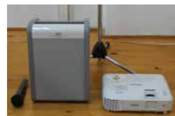
助成事業で新たに整備したプロジェクターやワイヤレスマイク。

宝くじ助成金で備品整備 一般財団法人自治総合センターは、宝くじの社会貢献広報事業として、宝くじの受託事業収入を財源とする「コミュニティ助成事業」を実施しています。この宝くじの助成金で、市内4か所の校区まち協事務所の備品を整備しました。ぜひ地域のコミュニティ活動に活用してください。