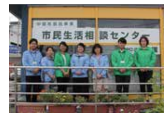
センターの職員と一緒に、生活上の問題を解決していきましょう。

困ったときは相談を 相談があった場合は、生活状況や家計面も含めて面談をさせていただきます。困りごとがすぐに解決することはないかもしれませんが、解決のために一緒に考えていきます。相談は事前予約制となっていますので、困っていることがあれば、まずは気軽に電話で問い合わせてください。相談は無料です。また、来所が難しければ出張相談も行います。