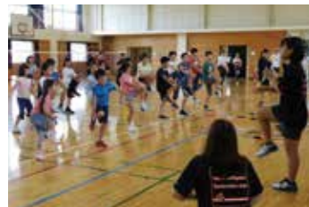
参加者全員で準備運動を行い、どの試合も白熱した展開に。

地域のみなさんから風車や竹笛、ゴム鉄砲などの作り方を習い、立派な作品が完成した子どもたちは大喜び。自分たちで作った作品で遊んだり、けん玉やこま、お手玉などの昔遊びを習いながら、大人も子ども一緒に楽しむ姿がたくさん見られました。