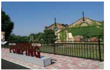
世界遺産も見学できます。

イベントの集合場所は、垣生公園の芝生広場ステージ付近です。9時から受付を開始し、10時にスタートします。