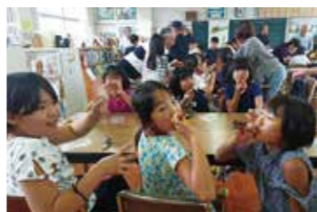
完成した竹笛を吹く子どもたち。綺麗な音が鳴り響く。

臨む中で、上達していく子どもたちの姿はとてもたくましく見えました。また、みんなでかき氷を食べて涼む場面もあり、楽しく汗を流した1日でした。