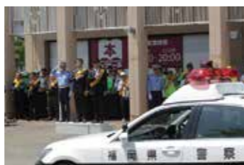
参加者たちに見送られ、警察車両がパトロールに出発。

青パトが交通安全を願うパトロールに出発しました。また、訪れた人に交通安全のチラシや啓発グッズを配布し、安全運転の徹底と飲酒運転の撲滅を呼びかけました。中間市では、平成30年度に4件の交通事故死亡事故が発生しており、例年と比べて非常に多くなっています。ドライバードライバーは、運転時に子どもや高齢者に配慮した運転心がけ、みなさんで「交通事故ゼロ」のまちを目指しましょう。