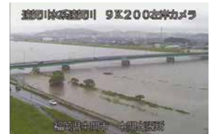
平成30年7月6日の中間大橋付近。(国土交通省遠賀川河川事務所中間出張所からの遠賀川ライブカメラ映像)

幸いにも中間市で大きな被害はありませんでしたが、遠賀川の中間水位観測所では観測史上最高水位となる5・52メートルを記録し、自然の脅威と災害に備える大切さを改めて感じさせられました。いざという時の心構えを常に持ち、家庭で4日分以上の食料などを備えましょう。