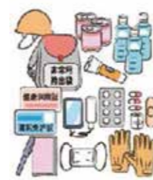
備蓄品の例 (非常持出袋、飲料水、アルファ化米、缶詰、常備薬など)

地震や集中豪雨など、各地で発生する自然災害。災害から身を守るために、日ごろから十分な備えを心がけましょう。