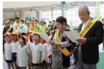
「信号を守ります」など交通安全宣言を読み上げるさくら保育園園児たち。

式典には中間市交通安全推進協議会や折尾警察署、市役所などから多くの人が参加。さくら保育園の園児と中間市老人クラブ連合会が合同で交通安全宣言を読み上げた後は、警察車両や