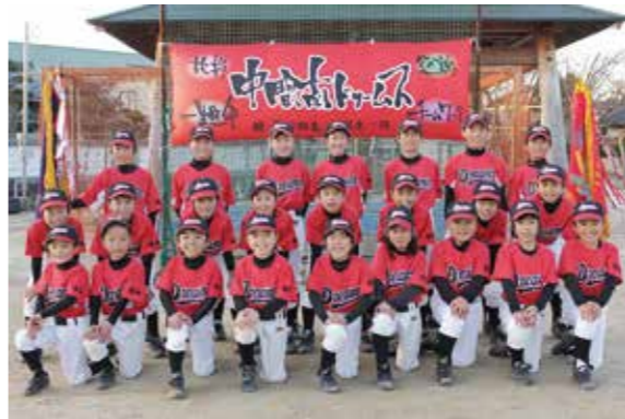
中間南ドリームス

スポーツで輝く人やチームのほか、市内や周辺地域で開催されるスポーツイベントなどを紹介します。