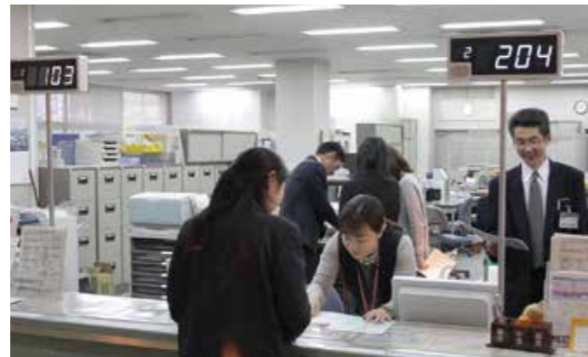
市民課の窓口にて3台の表示器を設置します。「証明発行」「その他届出」「年金」に分かれ、それぞれの要件に応じて受け付けで番号札をお渡しします。

広告モニターを設置 広告放映モニターを設置し、地元企業などの広告を放映する有料広告事業を開始しました。放映モニターでは、有料広告と合わせて、市の行政情報などを放映します。