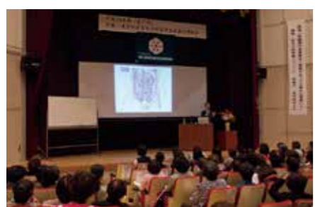
講堂の様子。(少人数での利用可)