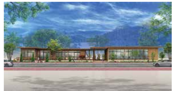
なかまチャレンジショップ(仮称)のイメージ

●注意 事項 ○作品に関する一切の権利は中間市に帰属します ○採用作品は一部修正・修正することがあります ○応募者の個人情報、本公募事業以外に使用することはありません ○応募に係る費用は応募者の負担になります