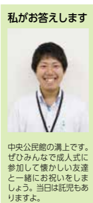
中央公民館の満上です。ぜひみんなで成人式に参加して懐かしい友達と一緒に思い出をしましょう。当日は託児もありますよ。

●A 成人おめでとうございます。中間市では12月中旬に本人宛に成人式の案内状を送付します。案内状が当日の「受付・記念品引換券」になるので、必ず持って来てください。転出者で成人式に参加したい人は、本人が家族が中央公民館に電話で申し込んでください。 ●日時 平成30年1月7日(日)・正午(受付は10時30分) ※11時30分からアトラクションがあります。 ●場所 なかまハーモニーホール ●対象 平成9年4月2日〜平成10年4月1日生まれの人