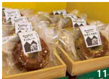
9 お客様の声を直接聞けるのが、楽しみと話す、宇都宮さん。 10 取材時に特別に焼いていただいた、焼き立ての「なかっぱまどれーぬん」。 11 焼きドーナツ。ラッピングには、なかっぱとポンプ室のコラボで中間市をアピール。