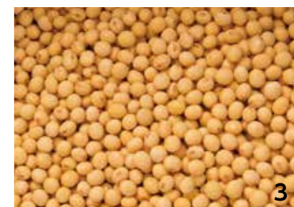
3 遠賀・中間の地元産にこだわった大豆。 4 蒸し上がった米を広げ、麴をもみ込む準備中。 5 「合わせみそ」。生産工程終了後に半年以上熟成させることでようやく完成する。