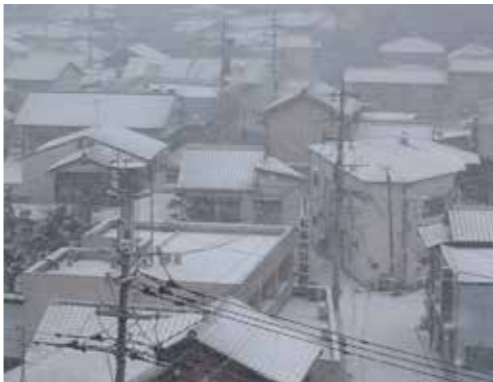
25日午前中の中間市内。前日からの降雪で積もった雪の下で、水道管の凍結が進んでいた。

前週末から天気予報では、西日本を中心に「数十年に1度」の寒波がやって来ると予想されていました。中間市内でも水道管の防寒対策など