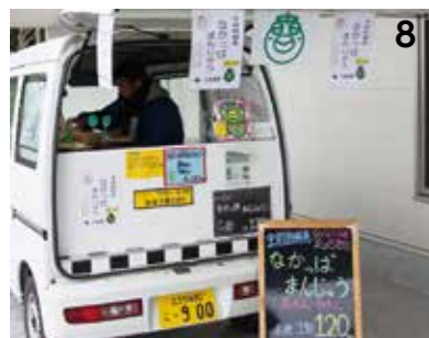
6 味だけでなく、お土産として楽しんでもらうために焼印と同じ柄の包み紙で包装。 7 おいしいと食べてくれる人の笑顔を見ると苦勞も忘れてしまうと話す、永野さん。 8 地域交流センター前で販売されている。