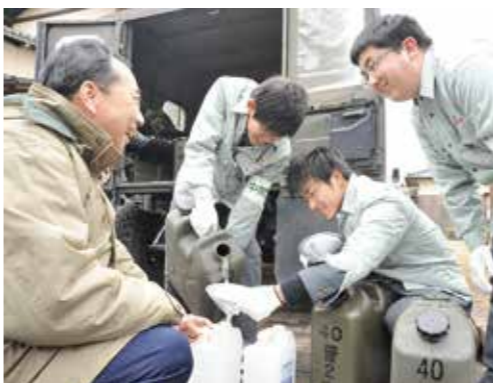
どれだけ技術が進もうと、災害時には人の手を使った支援が頼りになる。高校生の姿に笑顔を見せる市民も多かった。

市の要請を受けて、自衛隊の災害支援隊が到着したのが15時10分。そこから急ピッチで支援体制を築き、給水活動を開始。特に断水の影響が大きかった太賀、土手ノ内、浄花町、中鶴、長津を中心に給水活動を行いました。夜間には消防団の力も借りながら支援を行い、給水活動は21時まで続きました。