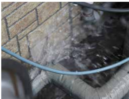
水道管の破裂によって起きた漏水。写真のように吹き出すような漏水よりも、じわじわ漏れる漏水のほうが圧倒的に多い。

漏水の発生は26日の朝を迎えても続きました。この日から市は空き家の漏水を問題視し、31戸の空き家をすべて点検。漏水している家屋の止水栓を閉めるなど対策を講じましたが、市全体の漏水量は給水量を上回