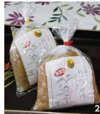
1 砂山加工組合の皆さん。写真左から安田香苗さん、田中昌子さん、長野充子さん、石井悦子さんが元気に働いている。 2 ほのぼの味噌は、「米みそ」と「合わせみそ」(麦入り)の2種類。田楽味噌や梅酢味噌などでいただくのがおすすめ。

砂山加工組合は、1987年に私たちの母たちが創業しました。世代が代わっても製法をしっかりと受け継ぎ、伝統の味を守っています。 原材料がシンプルだからこそ、その手順や温度管理などが少し違うだけで味が変化します。特に、夏や冬で気温が異なる温度の管理はとても難しいです。ただ、その難しさが味噌作りの楽しさでもあります。 こだわりの素材で作ったふるさとの味をご賞味ください。