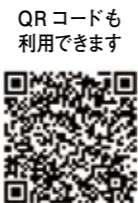
QRコードも利用できます