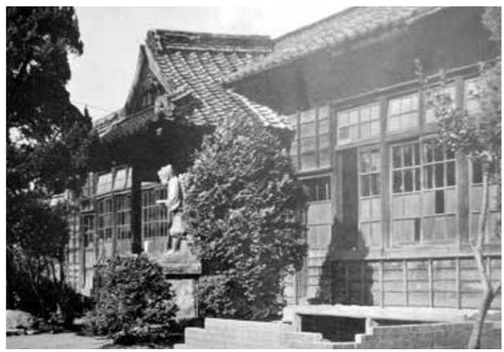
昭和30年 底井野小学校