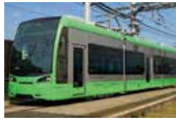
3月1日から運行している新色の低床式電車。

低床式電車は、高齢者、体の不自由な人が乗降しやすいように、駅ホームから車両床面までの段差がほとんどありません。