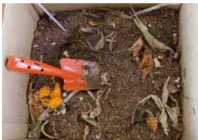
ダンボールコンポストを活用して、堆肥を作っているところ。