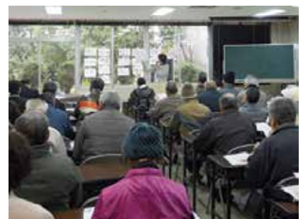
中間市シルバー人材センターで行われた認知症サポーター養成講座。

中間市でも、シルバー人材センター会員を対象とした養成講座が開催され、「認知症の早期発見が必要」「認知症と思われる人を発見したら地域包括支援センターに早く連絡・相談する」といった学びや気づきが得られました。 あなたも認知症サポーターになりませんか。養成講座の開催を希望する人は、地域包括支援センターに相談してください。