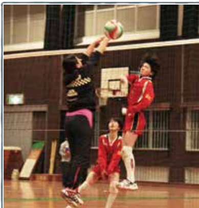
中間西少女バレークラブ

スポーツで輝く人やチームのほか、市内や周辺地域で開催されるスポーツイベントなどを紹介します。