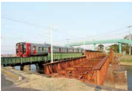
左) 手前の橋梁が室木線跡、奥は鹿児島本線下り。