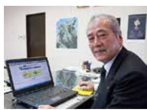
松下俊男市長もe-Taxを利用して申告しています。

※ e-Taxとは、申告などの国税に関する各種の手続きが、インターネットを利用して電子的に行えるシステムです。e-Taxを利用するには、開始届出書の提出や電子証明書の取得、ICカードリーダーライタの購入など、事前の準備が必要です。詳しくは若松税務署にお問い合わせください。 ● e-taxに関する問合せ 若松税務署 ☎(761)2536