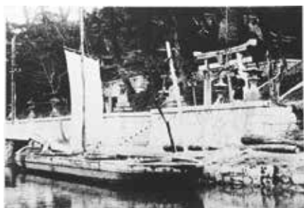
左) 大正時代の河守神社前(水巻町吉田東)の堀川。川ひらたが帆を揚げるのは珍しい。