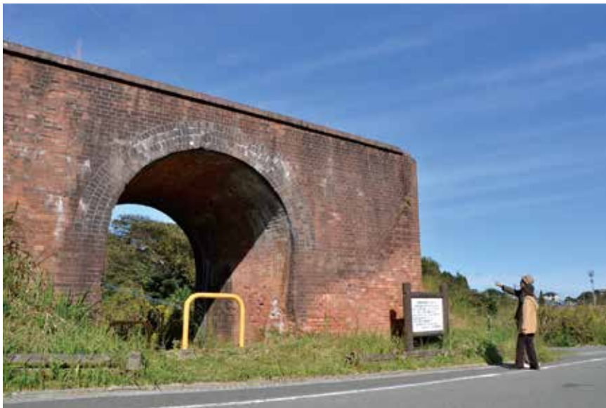
上) 美しいアーチを描く、レンガ造りの橋梁（岡垣町指定文化財）。 左) 赤レンガアーチに代わり現在も鉄道の往來を支えるレンガ造りのトンネル（写真左のトンネル）。

このころの橋梁には、簡単に手に入り、外観が美しい素材として、レンガが多く使われていました。道路と立体交差になっていたレンガ造りの美しいアーチは、今も明治文化の面影を残しています。