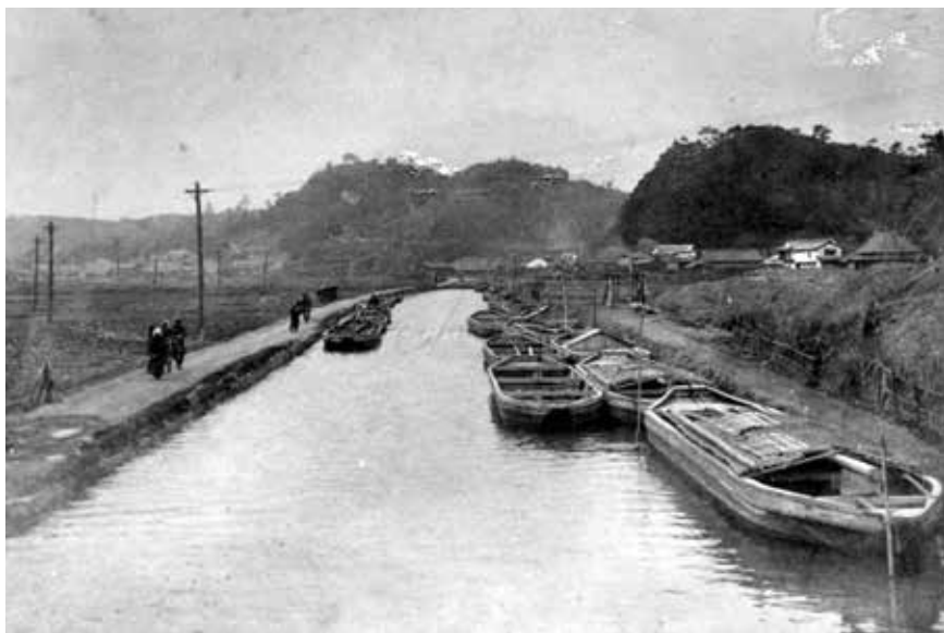
上) 明治時代中期の水巻町吉田付近。堀川に多くの川ひらたが付けている。

遠賀川から洞海湾までの水運を可能にした堀川は、地域の石炭産業を活性化させ、それが官営八幡製鐵所の誘致へとつながっていきました。