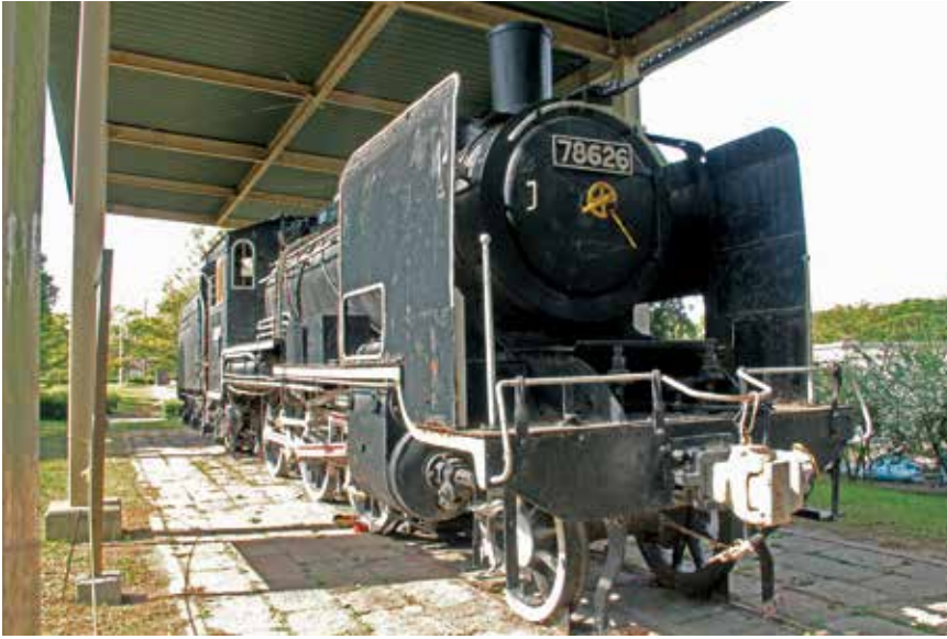
上) 遠賀川駅を発着していた8620形の蒸気機関車。活躍していた当時の姿のまま遠賀総合運動公園に展示されています。

石炭産業の黄金時代に重要な役割を担っていた遠賀川駅。基幹駅としてさまざまな路線をつなげていたのです。