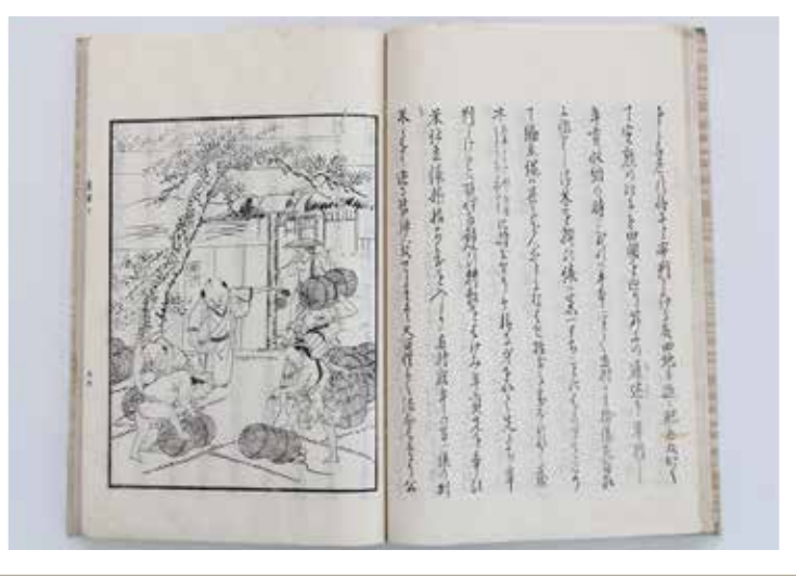
筑紫遺愛集卷十三

江戸中期になると、幕府や各藩が、義人、忠義者などを表彰し、表彰者の略伝を書物に記すようになります。この政策には、封建支配を進めるといふ側面がありました。一方、現代に遺されたこれらの書籍は、歴史の表舞台に立たない庶民の姿を知ることができる貴重な資料です。親孝行をした者、長生きをした者など、商人や農民の当時の姿が記録されています。