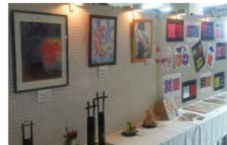
昨年、展示された絵画や陶器などの作品。

11月11日は「介護の日」です。これは、介護についての理解と認識を深めて、介護従事者や介護サービス利用者とその家族、それらを取り巻く地域社会の支え合いや交流を促進するための日です。「いい日、いい日、いい日、あつたか介護ありがとう」の「いい日、いい日」にかけています。 今年この「介護の日」にちなんで、「おじいちゃんとおばあちゃん作品展」を開催します。趣味で製作されている作品や、福祉・医療施設などでレクリエーションやリハビリの一環で作成している作品を募集します。 「いい日、いい日」で頑張っている高齢者の皆さんの自慢の作品をお待ちしています。 ●展示期間 11月10日(土)～22日(日) ※土曜・日曜日は休みです。 ●展示場所 市役所本館1階ロビー ●出品作品を募集します ●応募資格 市内在住または市内の福祉・医療施設に入所通所している高齢者(個人でも事業所単位でも可) ●応募作品 高齢者の作品