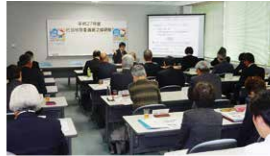
定期的に研修会を行い、制度や法律の勉強を行っている。

行政の橋渡しのような役割を担っていると考えています。住民の身近な相談相手として、定期的に開設している相談所などで、相談を受け付けます。さらに、相談に応じて現地を確認し、関係する行政機関と解決に向けた話し合いを行います。また、相談への