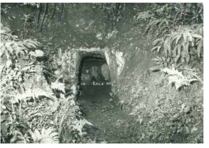
発見された宮田山横穴墓群

横穴墓は古墳時代後期から律令期まで遠賀川流域で盛んに造られたもので、市内でも数多く発見されています。そのうちの1つである宮田山横穴墓群は、鞍手町上木月と接する丘陵にあります。 この横穴墓群は、壁面が描かれていたことで有名な「瀬戸横穴墓群」が存在する丘陵の北西に近接しており、周辺の丘陵にも横穴墓が点在しています。 宮田山横穴墓群は、古くから知られていた遺跡ですが、きちんとした調査が行われたのは昭和53年のことで、このときに8基の横穴墓が発見されました。 その後、平成3年に開発工事による緊急発掘調査が行われた際には、新たに3基の横穴墓が発見されています。 宮田山横穴墓群は、他の横穴墓と同じような造りですが、中には屍床となる棺台が造られているものもあり、比較的丁寧な造りであったことが伺えます。 そして、これら横穴墓群の中から、土師器や須恵器といった器や、鉄鍬などの武器が発見され、おおよそ6世紀後半から7世紀代に造営された横穴墓群だったことも判明しています。 なお、現在もこの丘陵には数多くの横穴墓が眠ったままです。今後も新たな発見があるかもしれません。