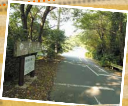
岡垣町・ゆうれい坂 (A-3)