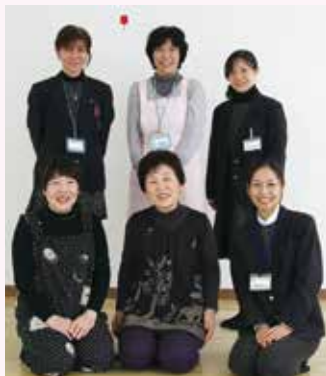
参加をお待ちしています。

2月17日のわんぱく広場では、節分にちなんで、鬼に、豆に見立てたボールを当てる遊びをしました。参加した子どもたちは、布で作られたやわらかいボールを的の鬼の顔に当てて楽しみました。ほかには、手遊びや絵本の読み聞かせ、親子で体を使った遊びなど、いろいろな遊びをしました。