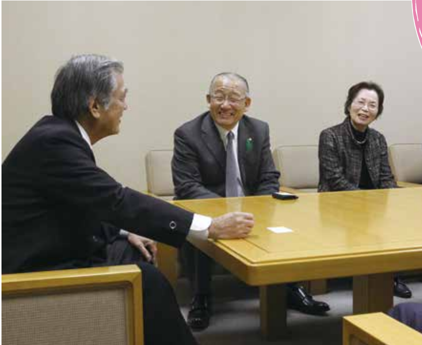
2月12日・北海道月形町の櫻庭誠二町長が表敬訪問