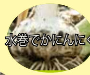
水巻でかにんにく