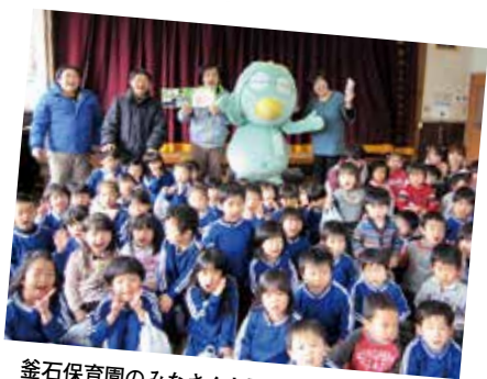
釜石保育園のおみなさんと記念撮影。明るく元気な子どもたちでした。

今後可能な限りこの活動を続けていきたいと思っておりますので、みなさんのご協力をよろしく願います。