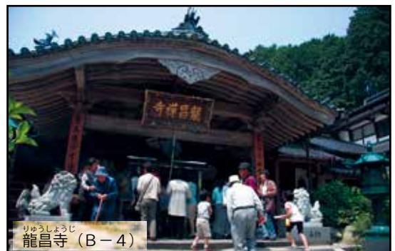
りゅうしよじ 龍昌寺 (B-4)

大河ドラマ「軍師官兵衛」に登場している井上周防(九郎右衛門)ゆかりの寺。1・5・9月の15日には、開運や安産などを祈願するせんじゃ封じが行われ、多くの人で賑わいます。近くには、旧遠賀郡21か村の総社である高倉神社もあります。