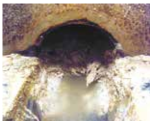
油やごみが堆積し固まったもの

しかし、最近下水道本管の油污れが目立つようになってきました。事業者や家庭から排出される食用油などは適正に処理し、下水道へ流さないようにお願いします。