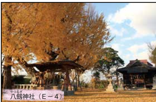
やつるぎ 八劔神社 (E-4)

県の天然記念物に指定されている八劔神社の大イチョウは、樹齢1900年を超えるといわれる大木です。「日本武尊と碓姫が結ばれた証として、この大イチョウが植えられた」との言い伝えが残されており、毎年11月中旬～下旬になると辺りを黄金色に照らします。