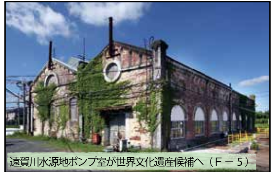
遠賀川水源ポンプ室が世界文化遺産候補へ (F-5)

平成25年9月17日、政府は「明治日本の産業革命遺産 九州・山口と関連地域」を平成25年度のユネスコ世界文化遺産推薦候補と決定しました。八幡製鐵所の鉄鋼生産を支えるため、現役で稼働している新しい価値を持つ産業遺産として国内外の研究者から注目を受けています。