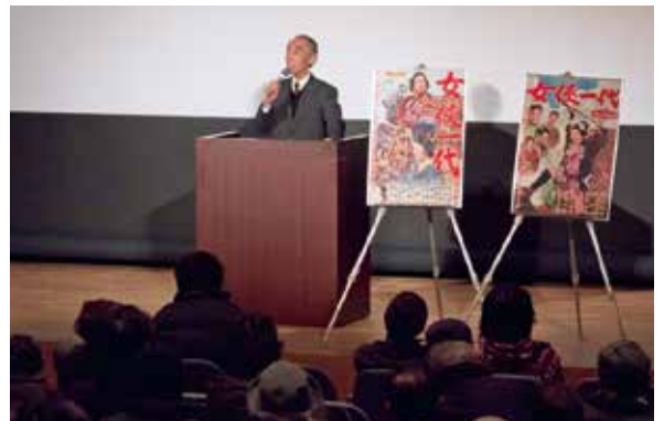
2月8日・映画「女侠一代」鑑賞会&解説トークショー

2月9日、「鉄道から筑豊炭田の近代化を探る」として、シンポジウムや関連イベントが行われました。シンポジウムでは、日本近代化の象徴である「鉄道」にスポットを当て、筑豊炭田が果たした役割などについて熱く語られました。ほかには、まくら軌会によるNゲージ走行会や、屋外では本物の石炭を燃やして動くミニSLの運行もあり、小雨にもかかわらず多くの来場者が搭乗し、たくさんの笑顔が見られました。