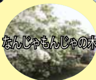
なんじゃもんじゃの木