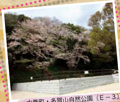
水巻町・多賀山自然公園 (E-3)