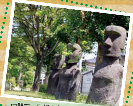
中間市・屋根のない博物館 (F-5)