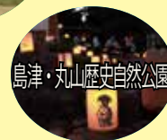
鳥津・丸山歴史自然公園