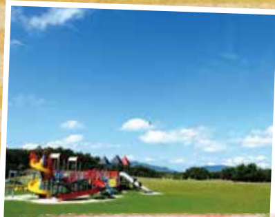
芦屋町・芦屋海浜公園 (D-2)