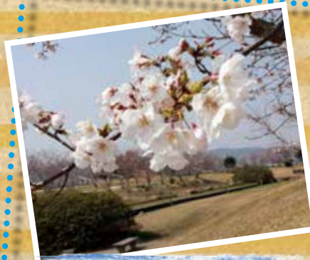
遠賀町・遠賀総合運動公園 (E-4)