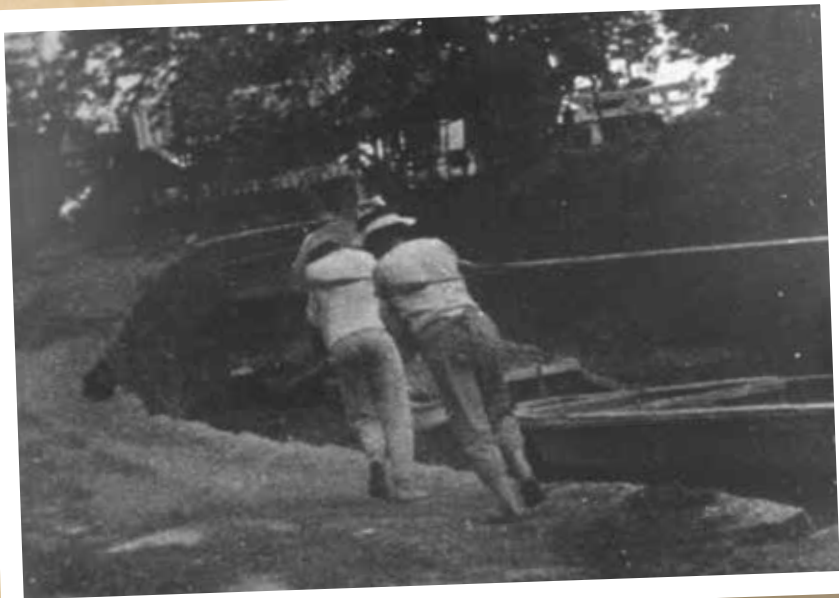
川ひらたを引っ張る船頭たち

筑豊の石炭採掘が盛んであった明治・大正時代、石炭の運搬は「川ひらた」という川船が主役でした。この「川ひらた」は平たくて底の浅い、川を行き来するために特化した形状をしていて、大きい物では全長約15mもありました。