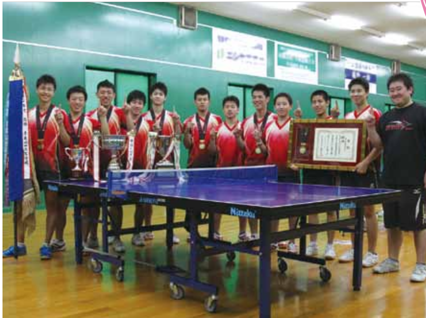
全国高等学校総合体育大会で、希望が丘高校男子卓球部が2冠