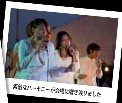
素敵なハーモニーが会場に響き渡りました