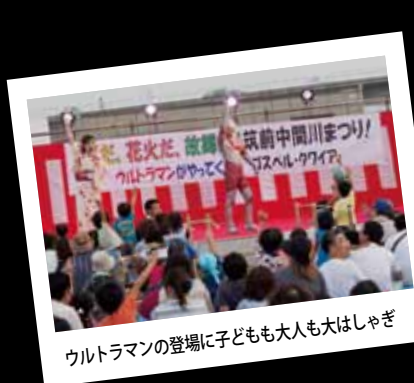
ウルトラマンの登場に子ども大人も大はしゃぎ