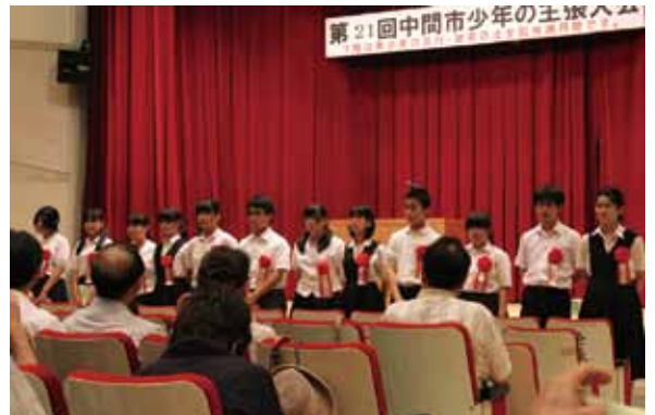
7月6日・中間市少年の主張大会