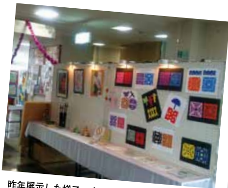
昨年展示した様子。今年はあなたの自慢の作品を展示してみませんか。

今回で6回目となる作品展。毎年たくさんの方が応募しています。昨年は126点の作品がロビーに並び、市役所を訪れた人たちの目を引きつけていました。