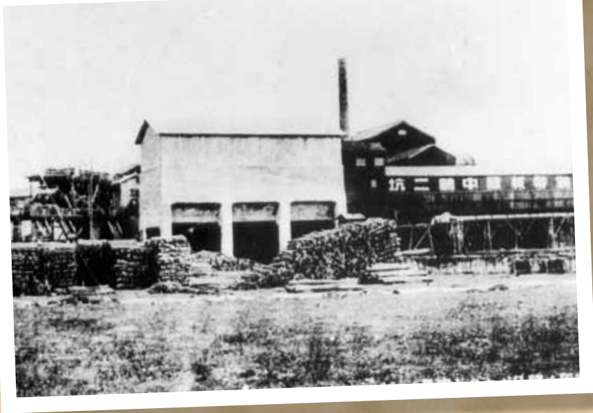
中鶴二坑の選炭所と積み込みポケット

明治時代になると、石炭が主要なエネルギー源となったため、石炭が埋蔵されている場所でも多くの炭鉱が開坑し、中間市でも、岩崎炭鉱など多くの炭鉱が開坑しました。中でも有名なのが明治39年に伊藤傳右衛門が当時の遠賀郡長津村字中鶴(現中間市)に開坑した中鶴炭坑です。中鶴炭坑は、明治42年には鉱区約55万坪、出炭量78,400t、鉱夫数約700人の大規模な炭坑です。