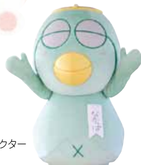
中間市公式キャラクター 「なかつば」

●応募・問合せ 総務課広報広聴係 (809-8501 中間一丁目1番1号) ☎(246) 6271