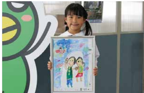
第36回こども絵画コンクールで銀賞を受賞 楽しかった水族館の絵を描いたよ

ジョイパルなかま庭球場の人工芝の張り替え工事が終わり、安全性などが大いに向上したことを記念してリニューアル記念式典が開催されました。当日は中間市硬式テニス協会や中間市軟式テニス連盟など関係者約100人が参加。テープカットの催しの後、テニス教室やエキシビジョンマッチなどが行われました。日ごろからテニスに親しんでいるみなさんは、時折指す強い日差しにも負けずボールを追って汗を流していました。