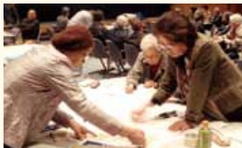
避難ルートマップづくり

平成23年度、中間西小学校区の全自治会に自主防災組織が設立されました。設立に当たっては、自主防災組織講演会や避難ルートマップづくり、避難訓練を実施しました。また、平成24年度は、中間小学校区の自治会で自主防災組織が設立され、避難ルートマップづくりを実施しました。今後は、みなさんの協力を得て、市内の全自治会に自主防災組織の設立をめざしていきます。