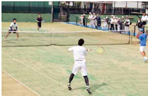
4月29日・ジョイパルなかま庭球場リニューアル記念式典 新しいコートにテニス愛好者が集う

ジョイパルなかま庭球場の人工芝の張り替え工事が終わり、安全性などが大いに向上したことを記念してリニューアル記念式典が開催されました。当日は中間市硬式テニス協会や中間市軟式テニス連盟など関係者約100人が参加。テープカットの催しの後、テニス教室やエキシビジョンマッチなどが行われました。日ごろからテニスに親しんでいるみなさんは、時折指す強い日差しにも負けずボールを追って汗を流していました。