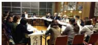
関係団体によるWAP会議

中間西小学校区では、PTAや児童部、青少年育成市民会議、自治会などと学校が連携して、児童の学力向上や安全確保、健全育成に取り組む「WAP(西小アクション推進協議会)」が組織されています。 WAPでは、これまで、ふるさとみまわり