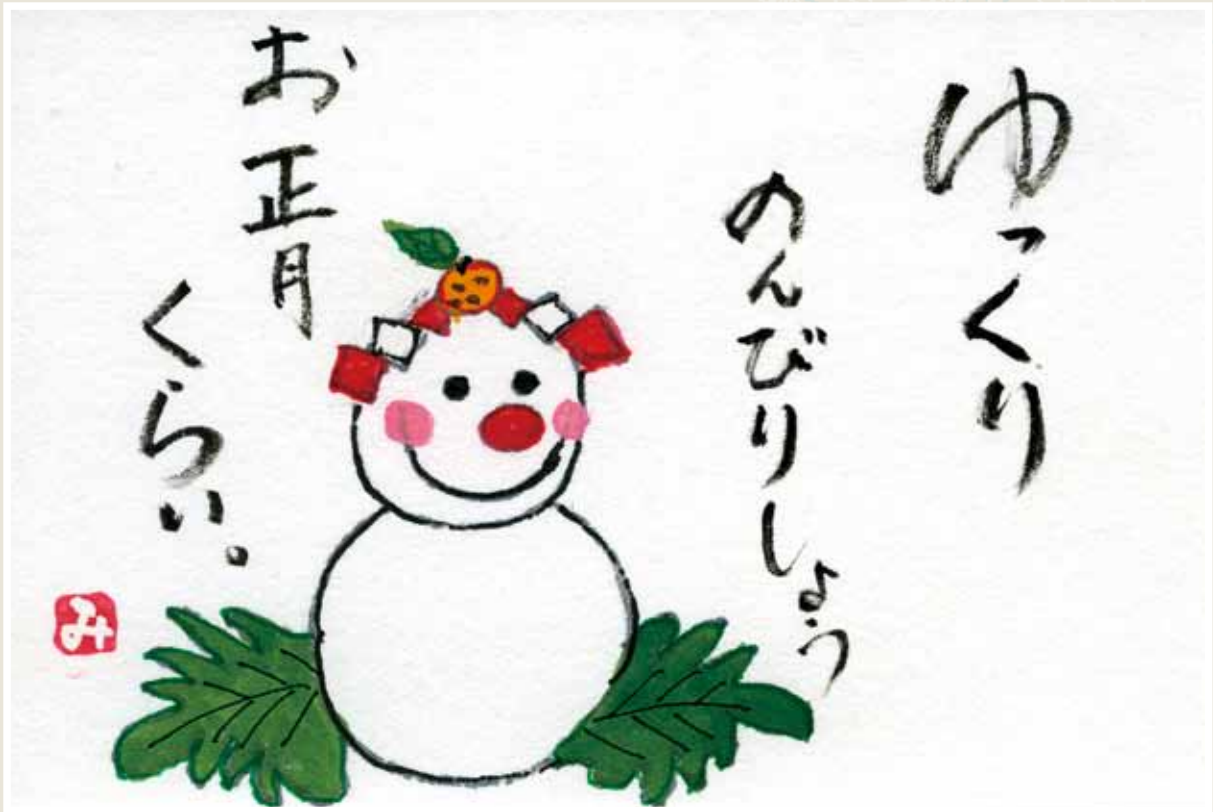
→ 衛藤ミナ子さん（上底井野）・作