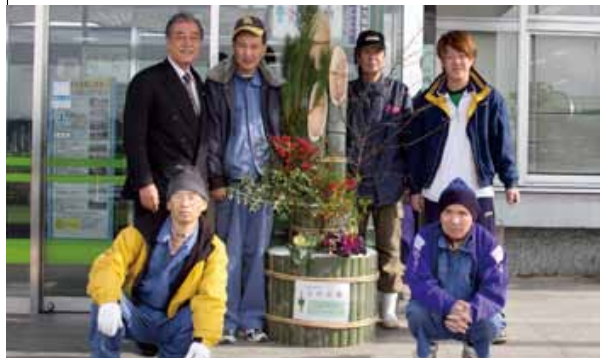
園生のみなさんが手作りした門松は、市役所本館玄関前に左右1本ずつ飾られました。

12月20日、上底井野にある知的障害者更生施設のみ園から門松の寄贈がありました。この門松は、日ごろ地元のみなさんにお世話になっているお礼に、感謝の意を込めて園生が一生懸命に手作りしたもの。市役所本館玄関前に飾られた門松は、正月らしい華やぎをもたせ、市役所を訪れるみなさんを温かく迎えてくれました。