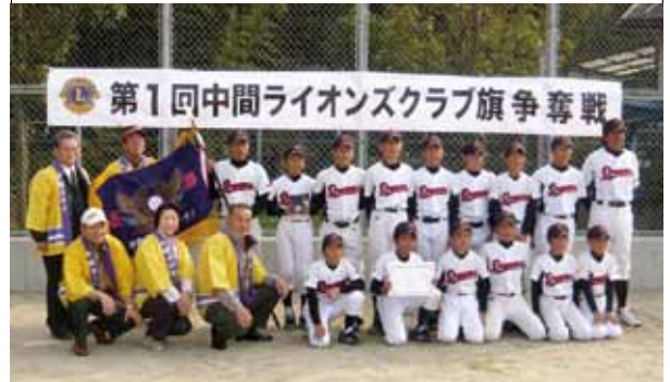
優勝：中間南ドリームスA 準優勝：中間タイガース 第3位：中間バッファローズ、中間南ドリームスB

11月13日、27日に、第1回中間ライオンズクラブ旗争奪戦野球大会を開催しました。元気のいい子どもたちの試合を通じて、子どもから大人まで笑顔あり、涙ありの、多くの人が感動と勇気をもたらした2日間となりました。今後も将来を担う子どもたちのため青少年育成に取り組んでいきたいと思ひます。