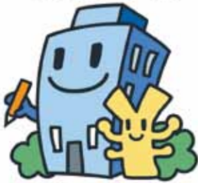
経済センサス マスコット 「ビルくん」と「ケイちゃん」

●調査項目 経営組織、従業員数、主な事業の内容、売上と費用の金額、事業別売上金額などの経理項目