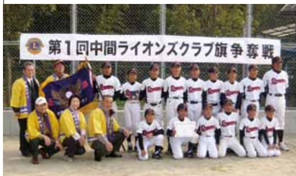
優勝：中間南ドリームスA 準優勝：中間タイガース 第3位：中間バッファローズ、中間南ドリームスB

11月13日、27日に、第1回中間ライオンズクラブ旗争奪戦野球大会を開催しました。元気のいい子どもたちの試合を通じて、子どもから大人まで笑顔あり、涙ありの、多くの人が感動と勇気をもたらした2日間となりました。今後も将来を担う子どもたちのため青少年育成に取り組んでいきたいと思ひます。