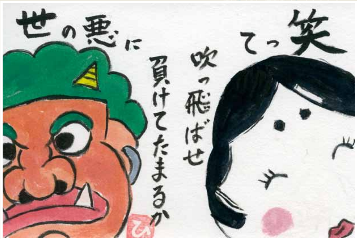
→ 田中弘子さん (砂山)・作