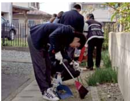
校区内の清掃活動を行う生徒たち。

12月22日、中間東中学校の全校生徒が、校区内の各公民館付近の清掃活動を行いました。この取り組みは、地域の人たちとの結びつきを強めるための奉仕活動の一環として行われているもの。生徒たちは、寒さに負けず熱心に清掃活動に励んでいます。