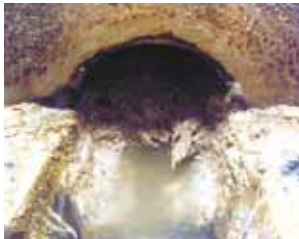
油やごみが堆積し固まったもの

しかし、最近下水道本管の油污れが目立つようになってきました。事業者や家庭から排出される食用油などは適正に処理し、下水道へ流さないようにお願いします。