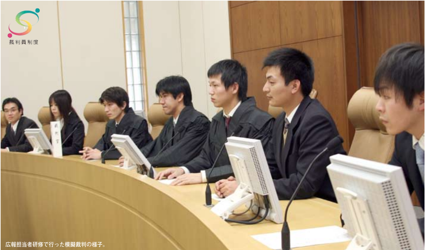
広報担当者研修で行った模擬裁判の様子。