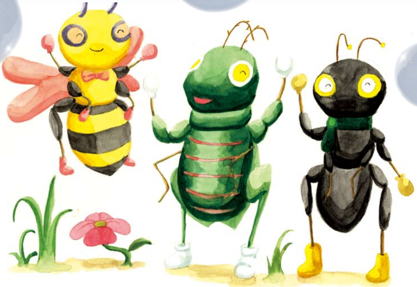
絵・入江みどりさん