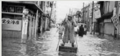
↑【写真左】昭和38年昭和町。【写真右】昭和35年昭和町。