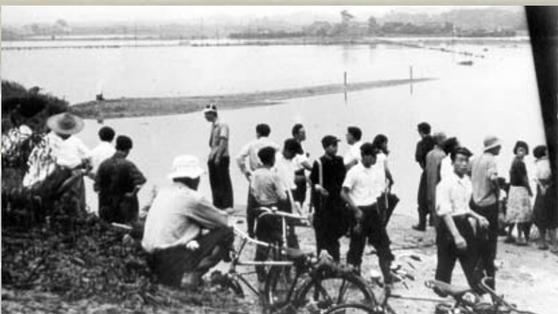
→【写真右】昭和28年昭和町。【写真左】昭和28年砂山地区。【写真下】昭和28年遠賀川。この年、遠賀川堤防が決壊。